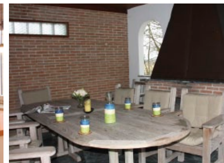
Eine einladende Terrasse für warme Sommerabende.