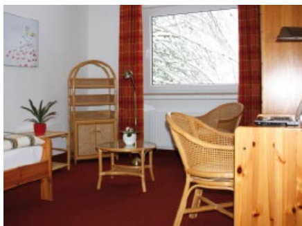
Gemütliche Schlafzimer zum Ausruhen.

„Man muss nicht in den ersten Tagen eine hektische Wohnungssuche beginnen und kann sich damit die Zeit nehmen, die man benötigt um seinen Platz zu finden.“