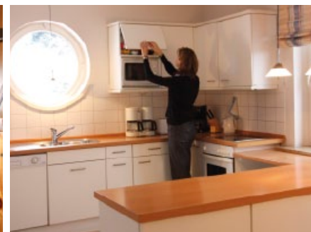
Eine vollausgestattete Küche für hungrige Mägen.